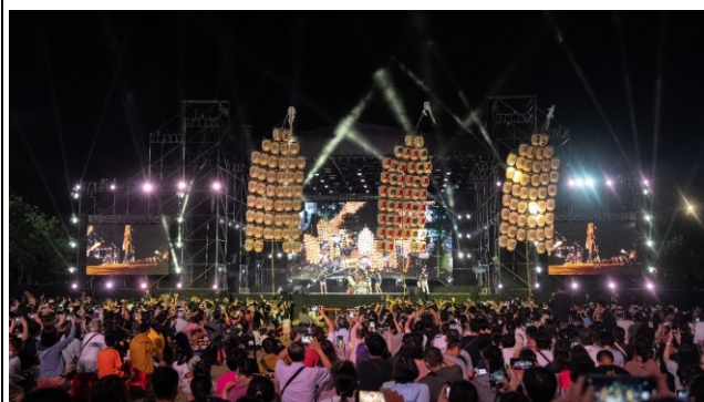
日本派遣秋田竿燈祭參與藝術節，順利完成臺南與日本之城市交流。