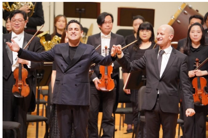
5 月 26 日全球歌劇巨星第一人—胡安·迪亞戈·佛瑞茲