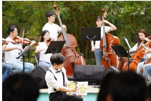
《淘憩時光》親子音樂會在總爺藝文中心戶外廣場演出