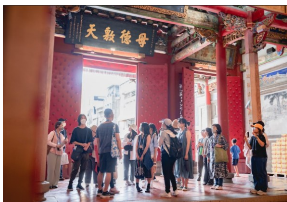
新藝獎小旅行—街巷時空藝迷蹤