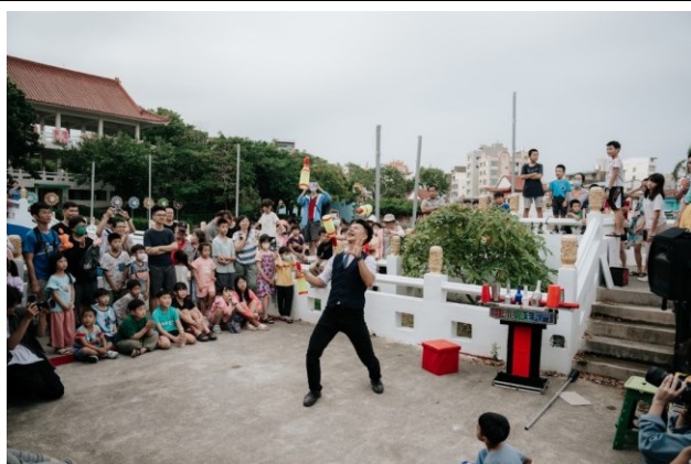
臺灣街頭藝術文化發展協會《臺南街頭生死鬥—街竿起藝》