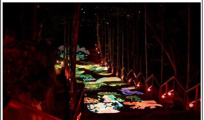
作品《溢流》由藝術家施佳岑與龍崎國中、龍崎國小、關廟國小在地共創，象徵著小朋友們是傳承文化的種子，也是未來的希望。