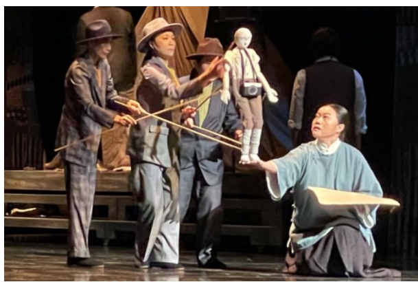
飛人集社劇團《藏畫》台南場

《夢斷黑水溝》為薪傳歌仔戲劇團頗受好評的作品，演出內容文武兼備，以本土劇種搬演屬於臺灣的故事，呈現精緻的歌仔戲藝術。薪傳歌仔戲劇團在 1989 年由「台灣第一苦旦」廖瓊枝老師創立，劇團宗旨為發掘與培養歌仔戲新秀，讓歌仔戲的表演藝術不斷傳承。