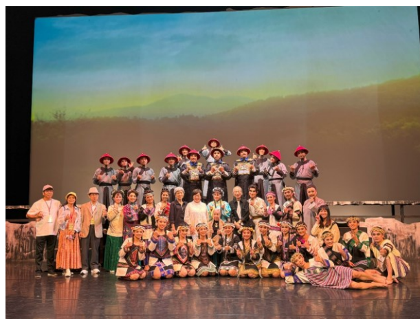
薪傳歌仔戲劇團《夢斷黑水溝》