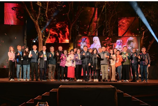
2024 龍崎光節空山祭開幕首度與霹靂布袋戲合作，配合霹靂別具特色的操偶技巧和 5G 科技的低延遲特性，利用龍崎獨特山林地景，搭建環境式立體舞台，以虛實共演方式，打造極具臨場感的沉浸式開幕專場《無盡魂》。