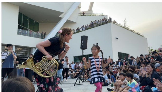
《當曼波遇見莫札特》在美術館戶外演出