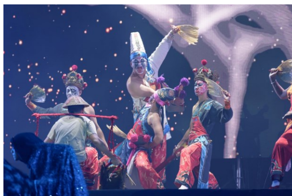
臺南 400 大戲《風調雨順》於藝術節首日登場，圖為臺南市全臺白龍庵如性慈敬堂八家將演出。

本屆藝術節亮點除享譽日本東北三大祭典之一的「秋田竿燈祭」外，首次參加藝術節的智利、波多黎各、阿爾及利亞等國家團隊也豐富今年藝術節的多元性與可看性。連續 9 日的藝術節活動，讓 10 月的臺南交織出一場跨越國界的多元文化盛宴，好評不斷，也讓參與本屆藝術節的觀眾人次高達 15 萬人次。