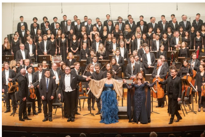
3 月 23 日維也納交響樂團

本屆音樂節規劃「Timeless Symphony」、「Infinite Melody」2 大主題，邀請包含國際小提琴天后慕特、第一男高音佛瑞茲、維也納交響樂團等精彩陣容，演出雋永的樂章。2 月 27 日至 5 月 26 日，集結在地與國際頂尖團隊，臺南國際音樂節 Timeless Symphony 共 8 場演出、5 場教育周邊，Infinity Melody 共 5 場室內及戶外的演出，總計逾 700 位音樂家、逾兩萬名觀眾共赴盛會、同賀「臺南 400」！