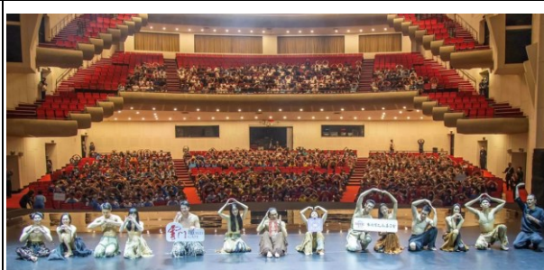
參與教育場之學生進行全體大合照。