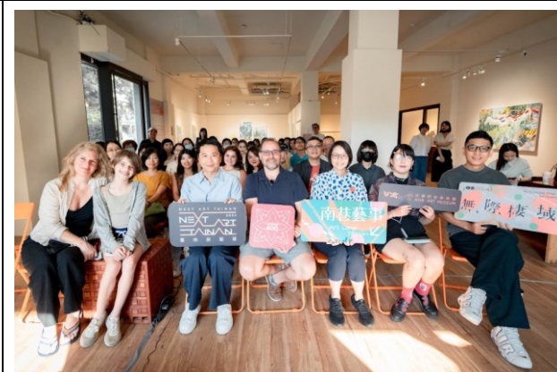
新藝獎藝術沙龍—當藝術走進社會這片棲地