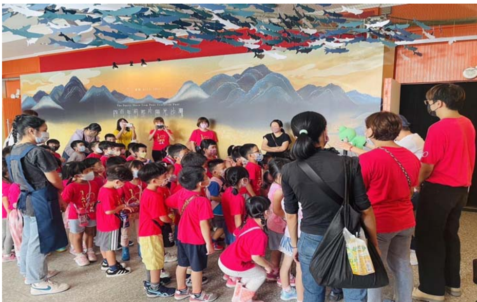
兒童教育團體導覽

展期自9月22日(五)至10月1日(日)在臺北空總展出，以當代藝術科技打造臺灣400年前的歷史地景，藉由史料策展與劇場格局特性，讓觀眾以「劇場式體驗」進入地圖裡的臺南歷史地景，沉浸式互動展演提供使觀眾體感認解臺灣進入世界舞台的時代背景以及地景發展變遷，也為臺南400系列活動進行暖身。2023文博會展覽期間參觀總人次逾10萬人次參訪，台南館共計辦理10場導覽、形象短片宣傳露出逾50萬次，成功塑造臺南歷史內涵整體形象新風貌。