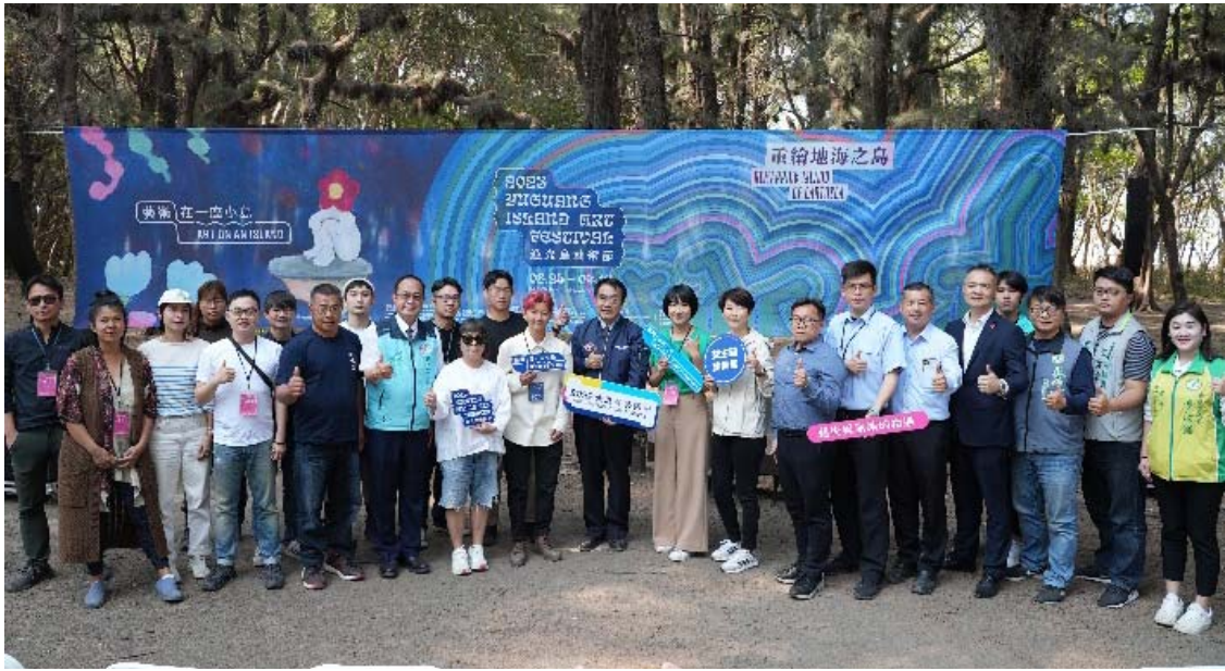
2023 漁光島藝術節記者會