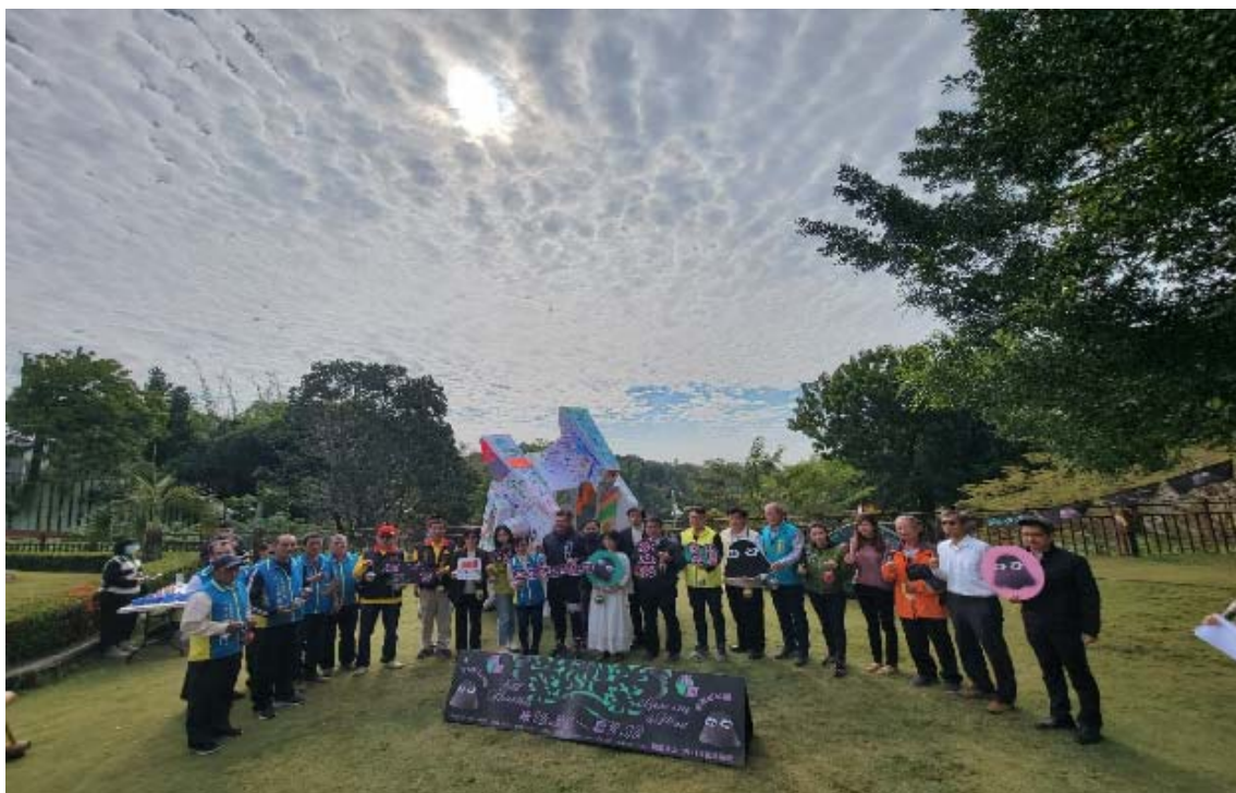
龍崎光節空山祭被網友喻為最美山林燈節，由市長主持開幕儀式

2023「龍崎光節：空山祭」活動更積極推動跨局處單位、區公所、農會、學校、在地行動團體等通力合作，並經營新聞露出、社群媒體營運、在地人文地產景及週邊行旅推廣介紹等，累積逾10萬觀展人次，整體售票率達7成5，銷售近8萬張票，票房成績逾581萬元，有效提高藝術光節營運效益，成功打造「最美山林燈節」口碑。