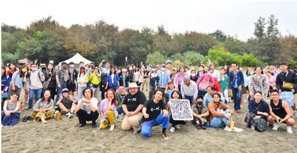
小事製作《一日編舞家》、《漁光島之聲》