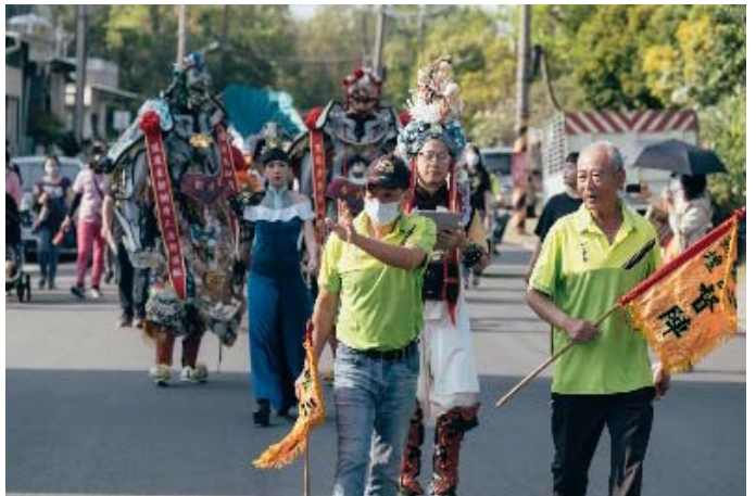
《鯤島神舟小遠境》與民眾互動