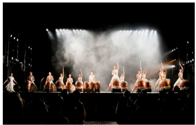
2. 歸仁開幕 優人神鼓《鼓聲圓滿》